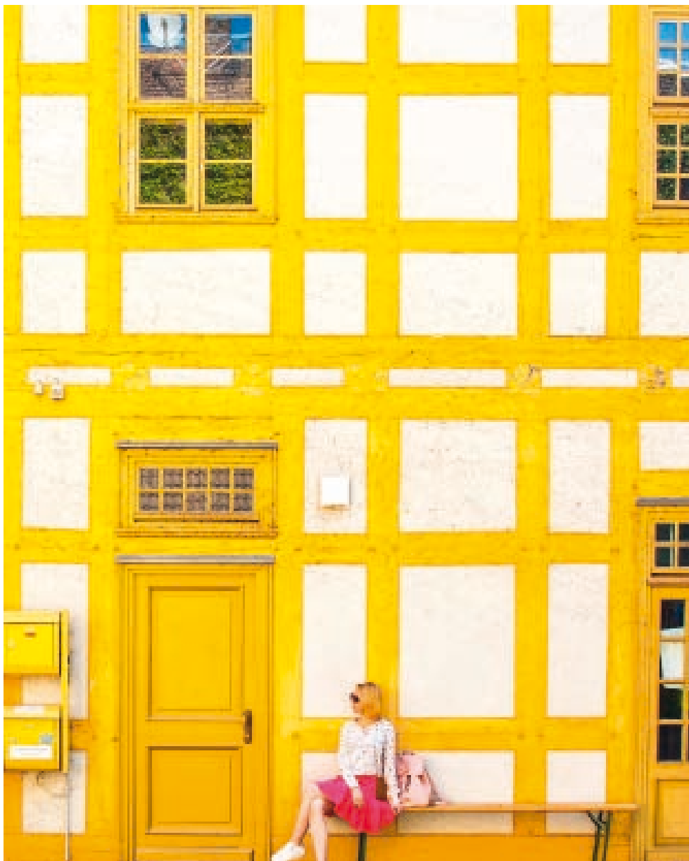
Anarquía amarilla, foto realizada en Potsdam (Alemania).